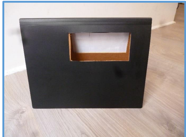
Découper puis recoudre les portes sur la pochette