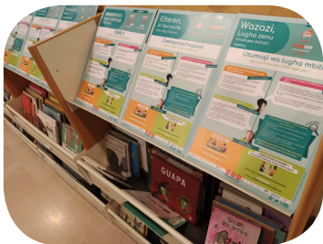
Photographie réalisée à la mythique bibliothèque Salaborsa à Bologne en Italie.