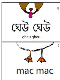
Le memory des onomatopées

Dulala propose différents jeux à télécharger et imprimer soi-même. Revisitant des jeux traditionnels, ces jeux éducatifs permettent de découvrir les langues qui nous entourent à partir de nombreux défis !