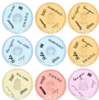
El doble plurilingue

en téléchargement libre sur le site de Dulala jeux traditionnels adaptés à tous les enfants pour leur permettre de découvrir la diversité des langues